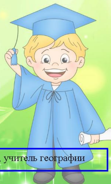
Езерская Н.А., учитель географии