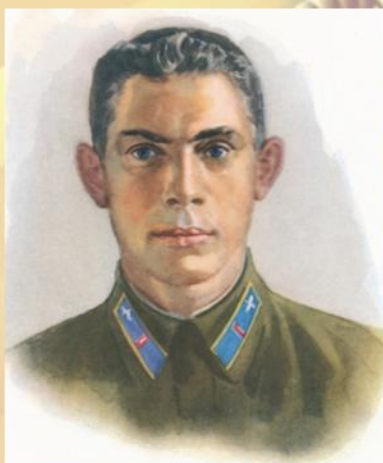
Николай Гастелло (1907-1941)

Военный летчик, командир 2-й эскадрильи 207-го дальнебомбардировочного авиационного полка, капитан. Работал слесарем, затем в 1932 году был призван на службу в Красную Армию. Попал в авиапункт, где стал летчиком. Николай Гастелло участвовал в трех войнах. За год до Великой Отечественной войны он получил звание капитана.