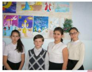
Мы рисуем Рождество