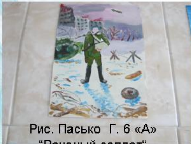
Рис. Пасько Г. 6 «А» "Раненый солдат"