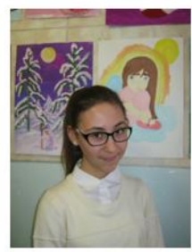
6 "А" Бабенко А. Рис. «Ангел»