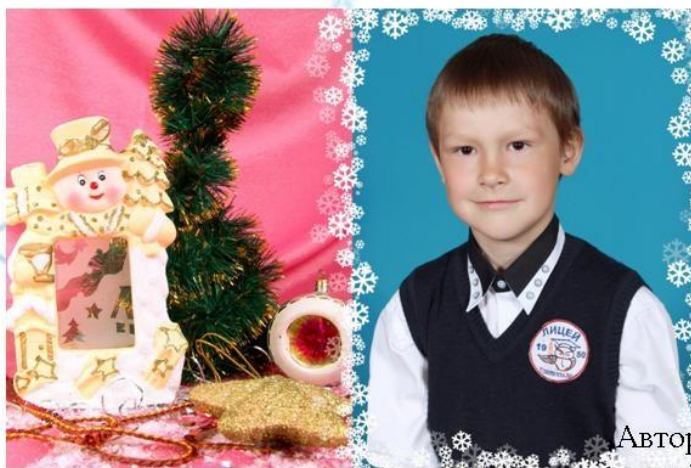
Автор: Пасько Серафим, МБОУ лицей г.Зернограда 4 «А» класс

Да, чудеса случаются, но не ради невидали бессмысленной, а ради спасения бессмертной души человеческой.